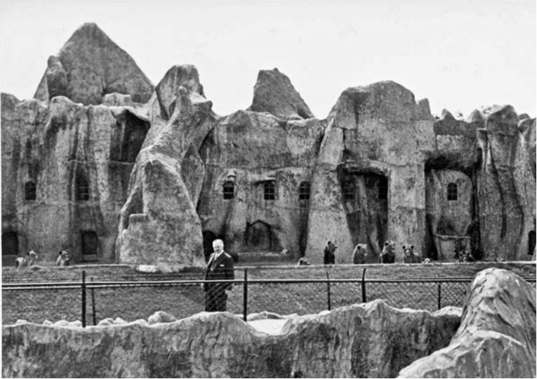
Opa voor zijn leeuwterras.