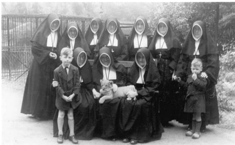
De nonnen van de Bewaarschool op bezoek. De non rechtsvoor kreeg een warme knie; het leeuwjtje was lek (1941).

dagen na de capitulatie komt het gewone leven weer langzaam op gang, alsof er niets is gebeurd. Een jaar later, als ik vijf geworden ben, mag ik naar de bewaarschool. Zo noemen ze het kleuterschooltje, gedreven door een paar lieve nonnen met enorme hoofdkappen.