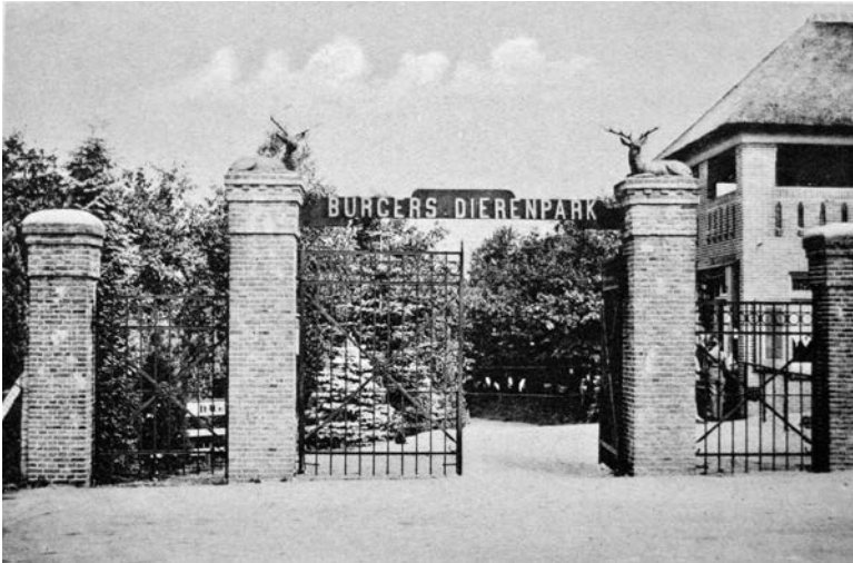
Woonhuis en entree te Arnhem.

Rotsen had je in Arnhem niet. Dus bouwde hij uit cement prachtige miniatuurbergen, die de terrassen voor zijn leeuwenfamilie omzoomden. Aan de bezoekerskant zat als afscheiding een diepe gracht. Maar die zag je niet, want de gracht lag achter een talud. Voor je gevoel kon je zo naar de leeuwen toe lopen. De ijsberen zaten in een reusachtige vallei, die – als je door je ooghaan keek – wel een beetje op een poollandschap leek. Tralies waren er nauwelijks. Het was een revolutionair concept in die vooroorlogse jaren.