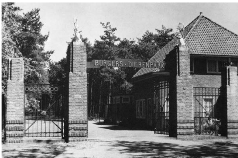
Tilburg, een kloon van Arnhem.

Voor mijn vader vormde de komst van het Arnhemse dierenpark een opmerkelijke carrièreswitch. Hij werkte als advocaat en had nooit eerder iets met dieren gedaan. Als jongetje hadden de paters van het bekende abdij-internaat Rolduc hem voorbereid op een leven in de katholieke elite. Toch vestigde hij zich na zijn huwelijk met mijn moeder in Arnhem, waar ze bij mijn grootouders in gingen wonen. Hij hing zijn toga aan de wilgen. Alleen zijn driedelige grijze pak, dat hield hij aan. Het zou, verformfaaid door de dagelijkse bezigheden in het park, zijn handelsmerk worden.