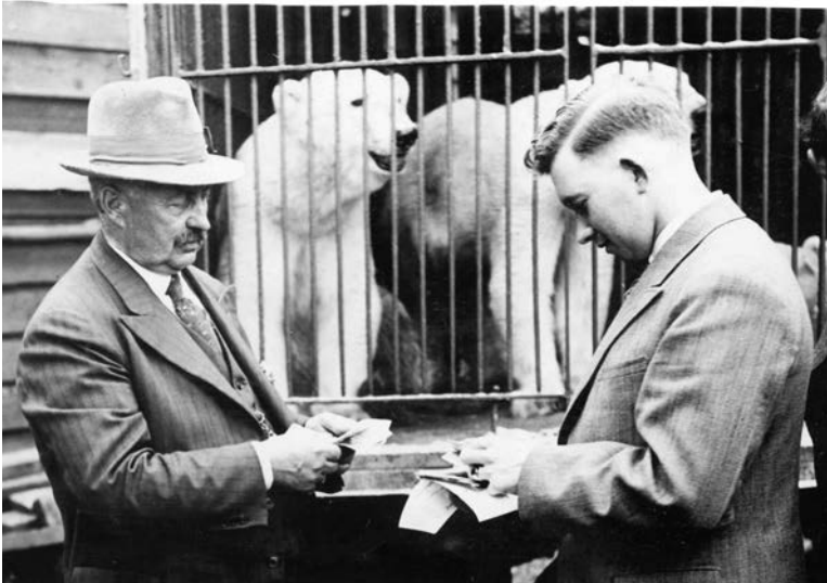
Opa koopt ijsberen van een circus in Duitsland.

de uitspanning makkelijk bereiken en voor toekomstige wijkbewoners was er van meet af aan een verbinding met de stad, die tot genoegen van de gemeente ook nog eens rendabel was. Mijn opa's zoo werd een van de grootste attracties van de stad.