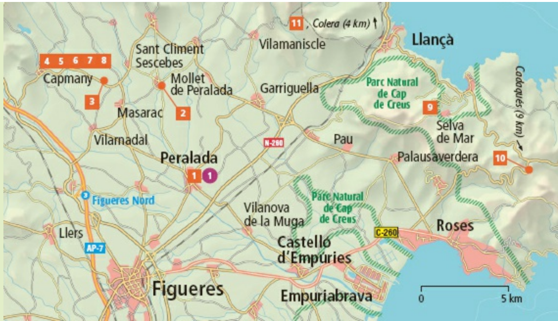
Uitneembare kaart: D-G 2-3