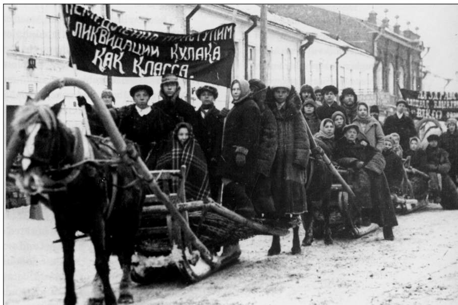
▲ Tijdens de landhervormingen van Stalin werden de koelakken, zelfstandige grote boeren, van hun eigendommen verdreven.

se agressie in Azië te bestrijden. Ook zag hij in de Sovjet-Unie een mogelijke bondgenoot tegen nazi-Duitsland.