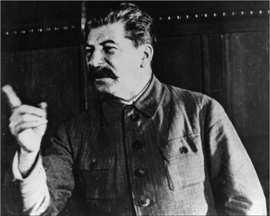
▲ Stalin: de onfeilbare leider.

mocraten als de objectieve bondgenoten van de fascistten en noemde hen dan ook 'sociaalfascisten'. Indien zij – de laatste verdedigers van het kapitalisme – werden uitgeschakeld, zou het kapitalistische Westen als een rijpe appel in de schoot van het communisme vallen. Dat werd tegengesproken door de verbannen Trotski, die integendeel vond dat communisten en sociaaldemocraten in een gemeenschappelijk front Hitler moesten bestrijden. Ook de Franse communisten waren vanaf 1934 openlijk de gedachte aan een Front Populaire genegen.