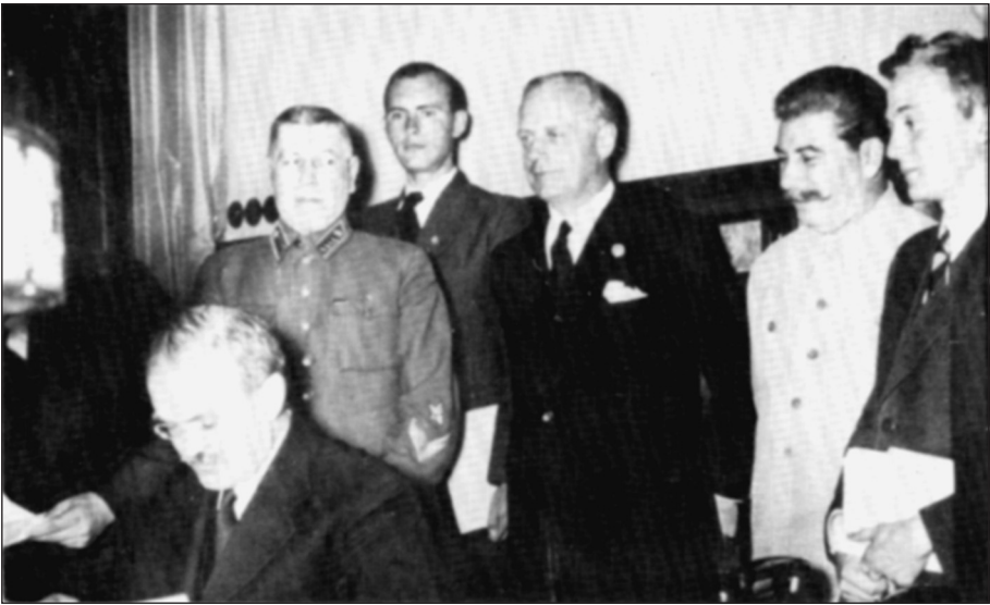
▲ Molotov ondertekent het duivelspact (23 augustus 1939). Achter hem staan zijn gelukkige Duitse collega Joachim von Ribbentrop en leider Stalin.

Stalins politiek werd geïnspireerd door deze ene gedachte: hoe de Sovjet-Unie uit de oorlog houden? Er waren twee mogelijkheden: ofwel zich aansluiten bij de Frans-Britse alliantie en op die manier Hitler afschrikken van een oorlog tegen Polen en hem zodoende ook van de Sovjet-Unie afhouden, ofwel op één of andere manier met Hitler overeenkomen door de Duitse verovering van Polen te erkennen. Vermoedelijk kwam er dan een oorlog tussen Frankrijk, Groot-Brittannië en Duitsland. De Sovjet-Unie kon dan rustig toekijken terwijl de kapitalisten elkaar afslachtten. Daarom was het van belang dat die oorlog zo lang mogelijk duurde. Na een eventuele overwinning zou Duitsland niet bij machte zijn om de Sovjet-Unie aan te vallen en zou het eerst proberen de toestand in de overwonnen gebieden te consolideren.