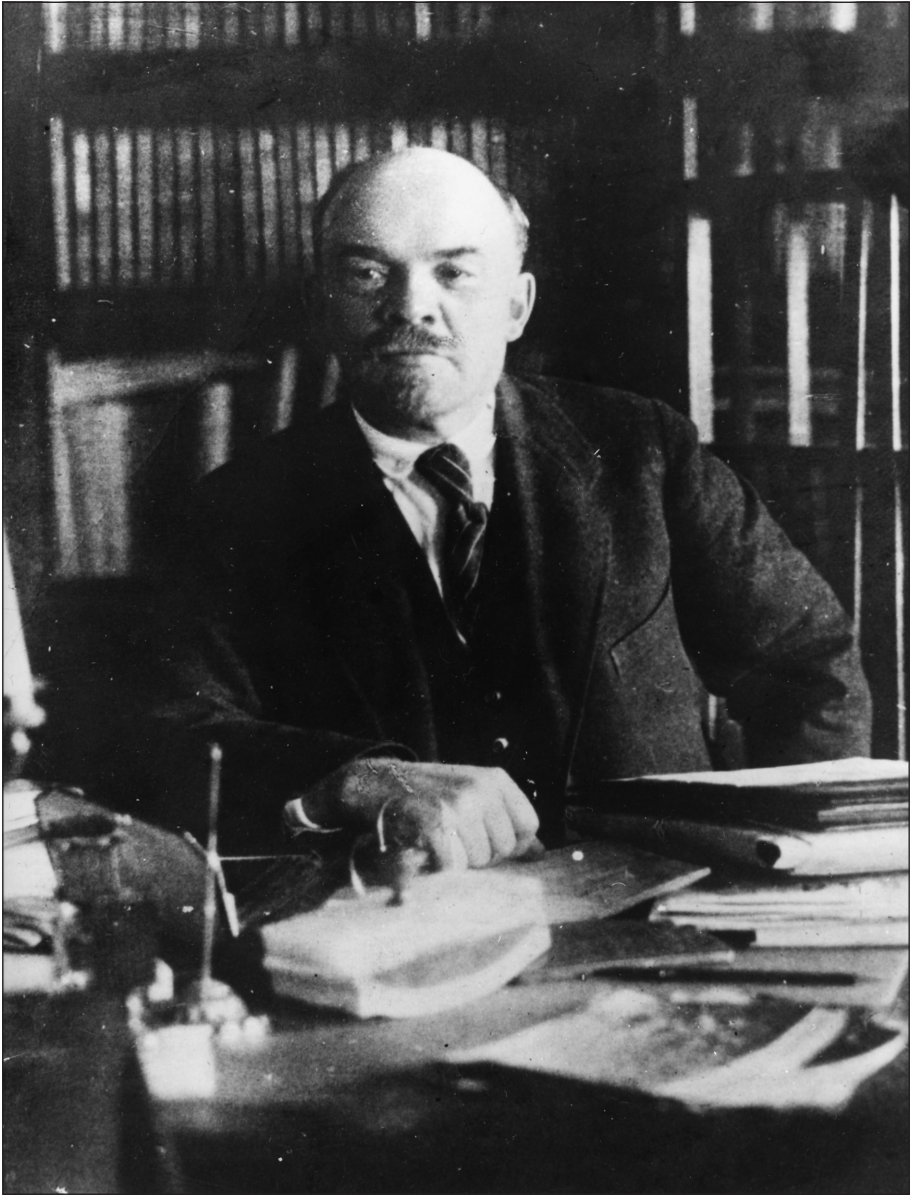
▲ Lenin, stichter van de Sovjet-Unie.

Het tsaristische Rusland streed met de Fransen, Britten, Belgen en andere bondgenoten tegen de Duitse en Oostenrijkse keizerrijken en hun bondgenoten. Het door de autocratische tsaar bestuurde Rusland was slecht georganiseerd en leed enorme verliezen. Al in maart 1917 telden de Russen vijf miljoen doden. De