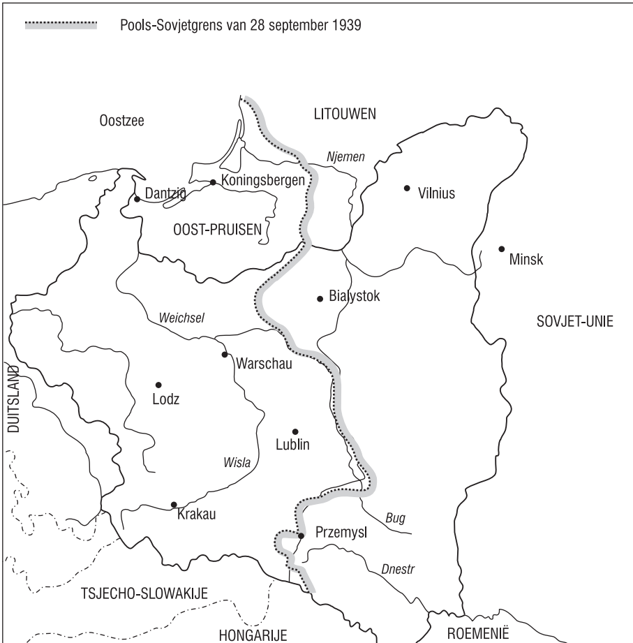
▲ De vierde verdeling van Polen.

samenwerking met Hitler. Dat gebeurde vooral in de landen die in oorlog waren met Hitler: Frankrijk en Groot-Brittannië. In deze landen vreesde de legerleiding voor een Duits-Sovjet-Russisch militair bondgenootschap; men plande zelfs acties tegen de Sovjet-Unie.