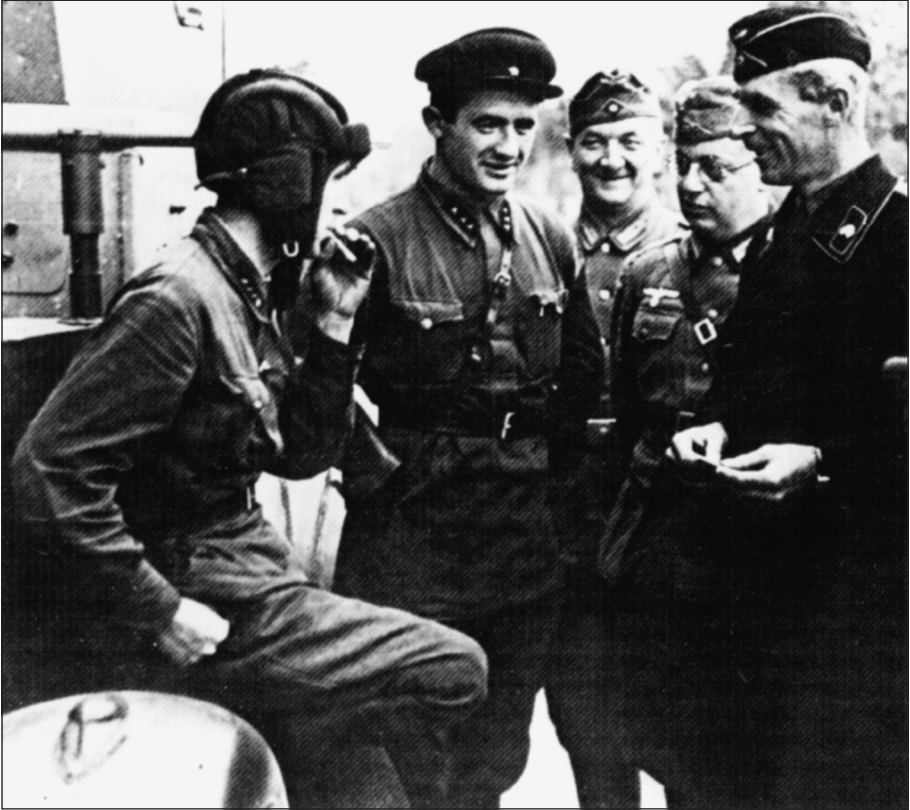
▲ Polen is verslagen. Zoals afgesproken ontmoeten Duitse en sovjettroepen elkaar in Polen.

Na de Poolse nederlaag werd op 28 september 1939 een nieuw geheim protocol aan het Duits-Sovjet-Russische verdrag toegevoegd. Er werd beslist Polen als staat te laten verdwijnen en Poolse territoria werden tussen beide partijen geruild. Op die manier kregen de Duitsers bijna alle Poolssprekende gebieden in handen, terwijl de Sovjets zich tevreden stelden met de Oekraïense en Wit-Russische. Deze gebieden werden vrijwel meteen bij de Sovjet-Unie gevoegd. In het kader van deze ruil werd ook Litouwen in de sovjetinvloedsfeer gebracht. In het nieuwe protocol leek het erop alsof de Sovjet-Unie bijna gereduceerd werd tot een onderdanige satelliet van Duitsland. Stalin moest massa's voedsel en grondstoffen leveren en zelfs toelaten dat de Duitsers een geheime bunkerbasis voor hun onderzeeërs op het schiereiland Kola uitbouwden.