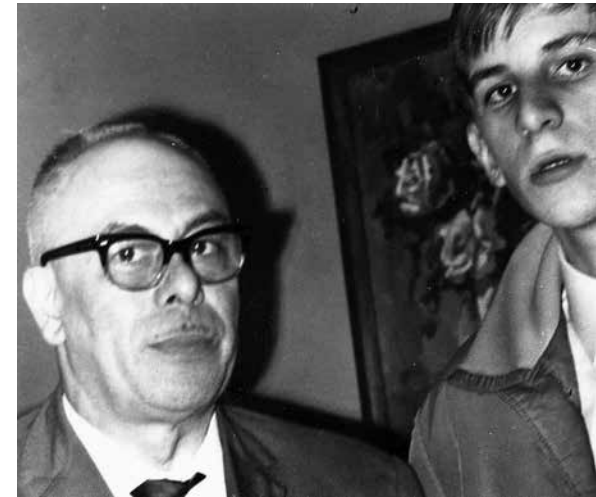
Met Johan Daisne op de foto, stedelijke bibliotheek, Ottogracht Gent.

Het beeld is scherp gebleven, net als de herinnering. Ik wandel in de zomer van 1968 naar de Gentse Openbare Bibliotheek aan de Ottogracht. In mijn tas een stapel boeken van Johan Daisne, die hij na een eerder gemaakte afspraak bereid is te signeren. Zoiets kon je indertijd maar beter vooraf vriendelijk vragen. Nu is het een ordinaire bezigheid geworden. Geen auteur ontsnapt er nog