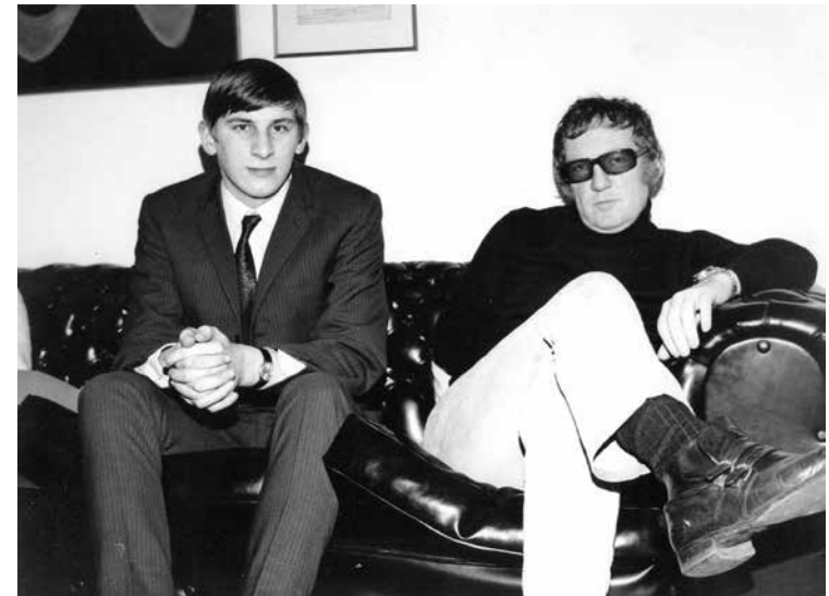
Ten huize Hugo Claus, Ten Hole, Nukerke 1969